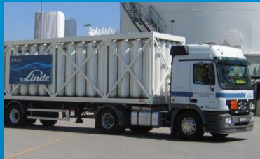
Gasförmig (z.B. 300 bar GH2 Trailer)