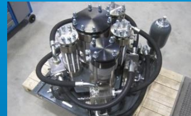
Verdichtung (z.B. Ionenkompressor)