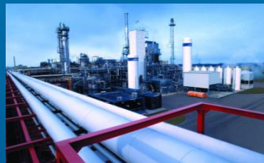
Pipeline (z.B. vom Erzeuger)