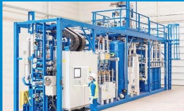
Steam Reformer (z.B. Steam Biomethan Reformer)