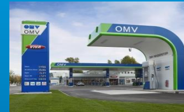
Stand-Alone Dispenser (z.B. für 700 bar und/oder 350 bar)