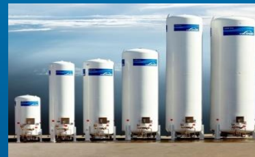
Flüssig (z.B. LH2 Tank)