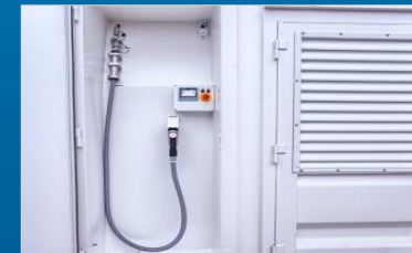
Integrierter Dispenser (z.B. 700 bar für mobile Befüllstation)