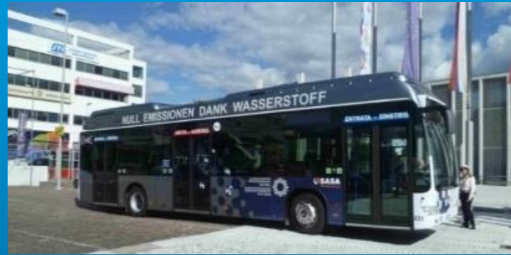
Versorgung von Wasserstoffbussen