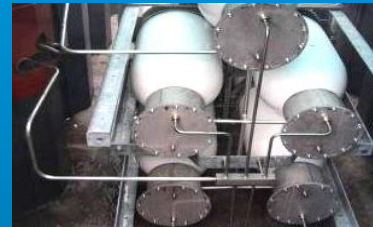
Gasförmig (e.g. 200 bar Tubes)