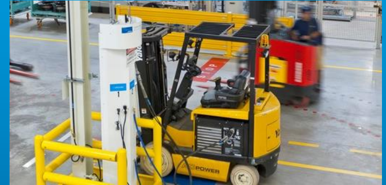
Versorgung von Flurförderfahrzeugen