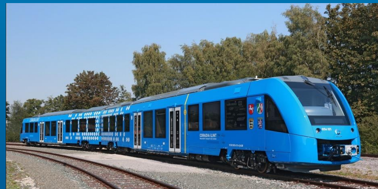
Versorgung von Wasserstoffzügen