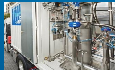
Kryogene Verdichtung (z.B. Kryopumpenstation)