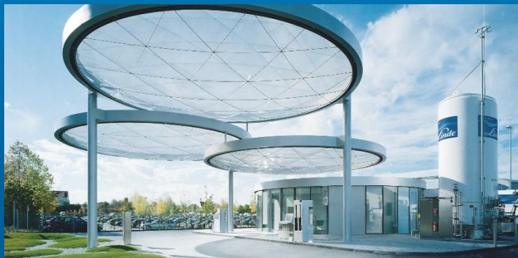
Versorgung von Wasserstoffautos