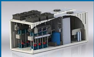
Elektrolyse (z.B. PEM oder Alkali)